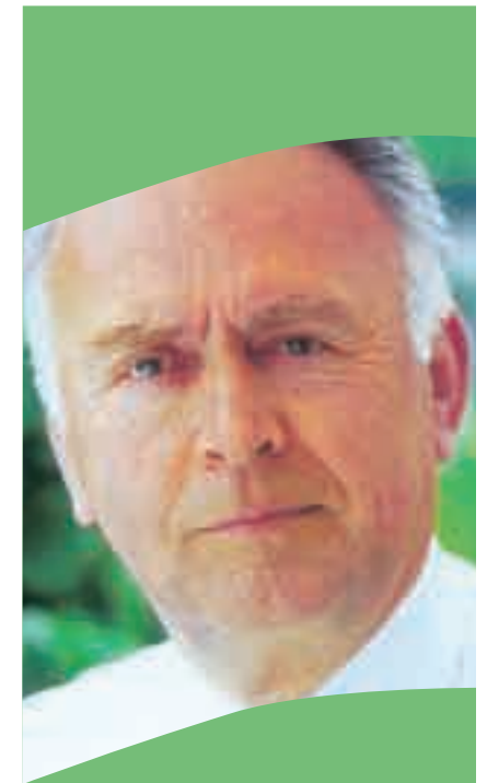
Prof. Dr. Wolfgang Böhmer Ministerpräsident des Landes Sachsen-Anhalt